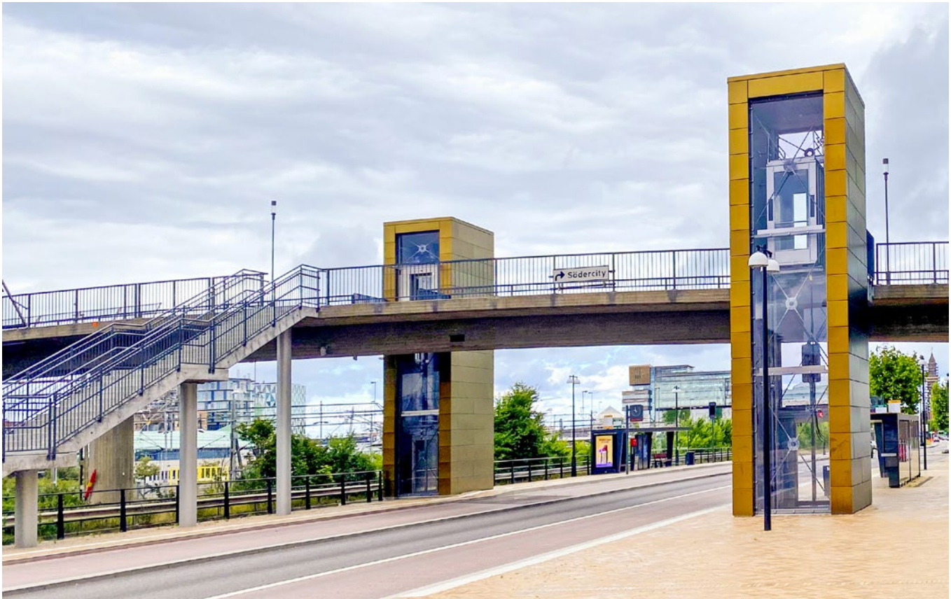
På uppdrag av Peab har FL Plåt klätt dessa hisstorn i Helsingborg.

plåtslagare. Sedan vill jag plugga vidare till arkitekt eller inredningsarkitekthållet.